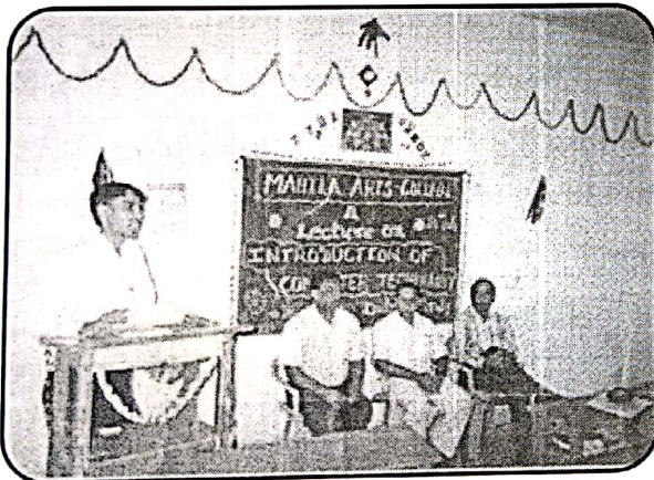
Computer Training Programme