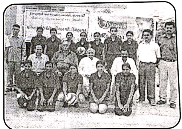
Runners up Team of Volley Ball