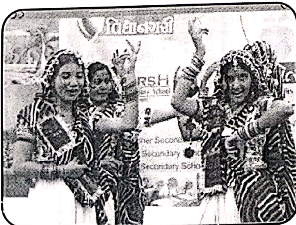
Annual Day Cultural Programme