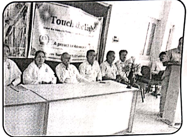
Opening of Touch the Light Centre